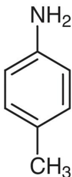
Figur 1. Strukturformel for 4-aminotoluen.